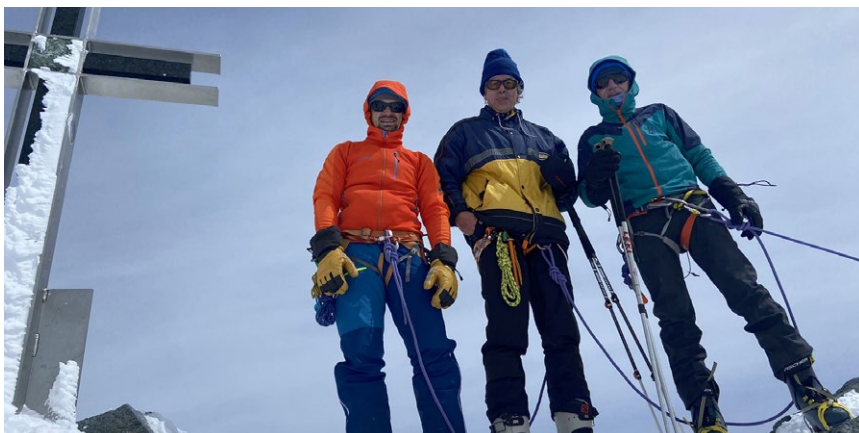
Skitourenwoche rund um die Britanniahütte