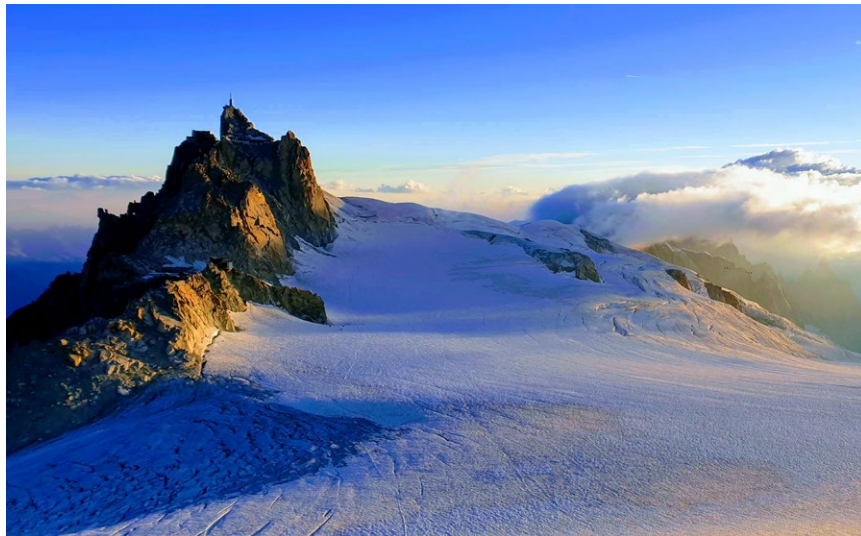
Aiguille du Midi, Mont-Blanc-Massiv, Frankreich

Wir vom Vorstand, speziell ich als Tourenchef, sind darauf angewiesen, dass ich von Interessierten erfahre. Gerne zeige ich auf, dass jeder noch so kleine Einsatz viel bewirken kann. Ein erster Schritt wäre zum Beispiel schon eine ein- oder zweitägige Tour/Veranstaltung als FABE-Leiter.