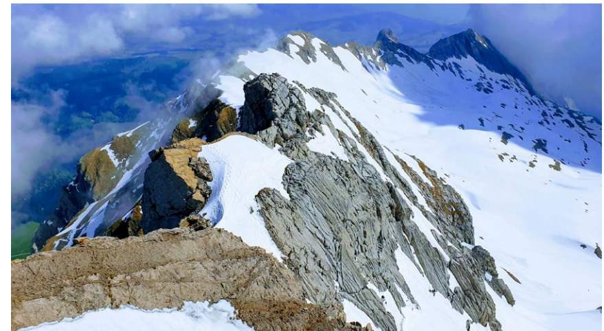
Ausblick vom Girensitz im Alpstein in Richtung Hüenerberg/Öhrli