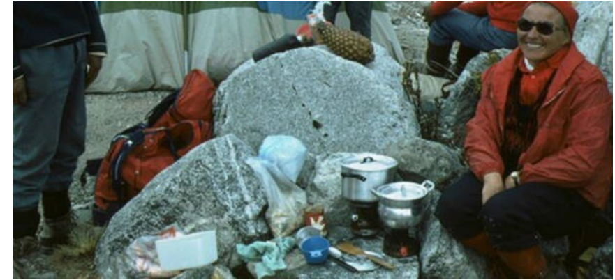
Rösti am Huascarán, 1980

Donnerstag, 24. August 2023, 18:30 – 20:30 Uhr