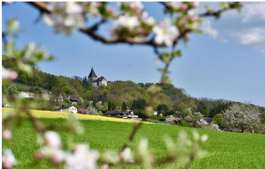
Der Frühling hat im Thurgau definitiv Einzug gehalten