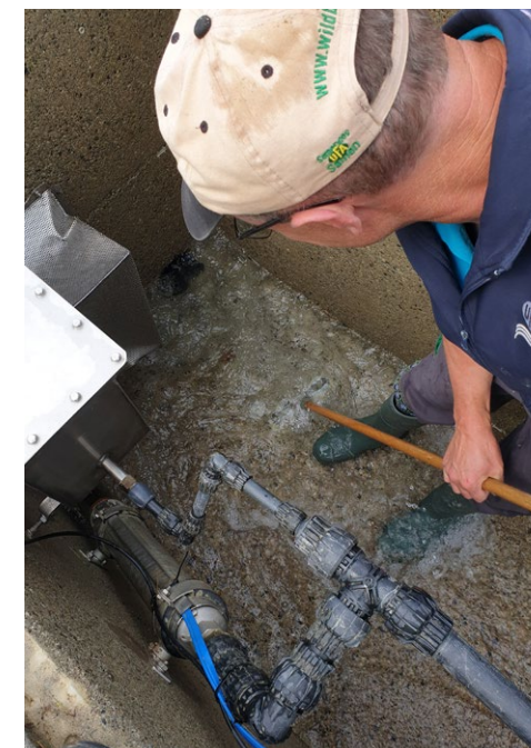
Res bei Unterhaltsarbeiten