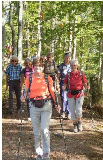
Sektionstour Belchenflue vom 5. Oktober 2023 (oben Mitte und unten links) Sektionstour Bantiger vom 12. Oktober 2023 (unten rechts)