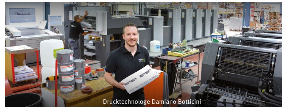
Drucktechnologie Damiano Botticini