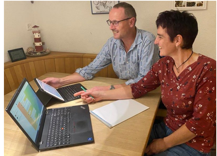
Die Hüttenwarte bei ihrer administrativen Arbeit

Die Etzlihütte reiht sich aktuell schweizweit in den vorderen Rängen bezüglich der selbstproduzierten Energie ein und ist entsprechend klimafreundlich. Brennholz benötigen wir praktisch nur bei kühlerer Witterung, um den Jacuzzi auf eine angenehme Temperatur aufzuheizen. Die Hauptwärme wird seit zwei Jahren von einer Luft-Wärmepumpe erzeugt. Gas, unsere zweite vom Tal zugeführte Energie, brauchen wir zum Kochen und Backen. Gas kommt dann zum Einsatz, wenn der selbstproduzierte Strom nicht ausreicht. Ebenfalls wird die Hütte mit dem selbst produzierten Strom über das ganze Jahr beheizt. Aktuell verbrauchen wir etwa 1,5 Ster Brennholz (Tanne) und etwa 140 kg Propangas pro Jahr. Da das Holz als CO 2 neutral gilt, stossen wir beim Gasverbrauch im Jahr ungefähr 450 kg CO 2 aus.