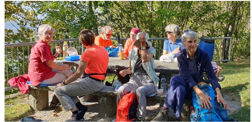
Sektionstour Bantiger vom 12. Oktober 2023