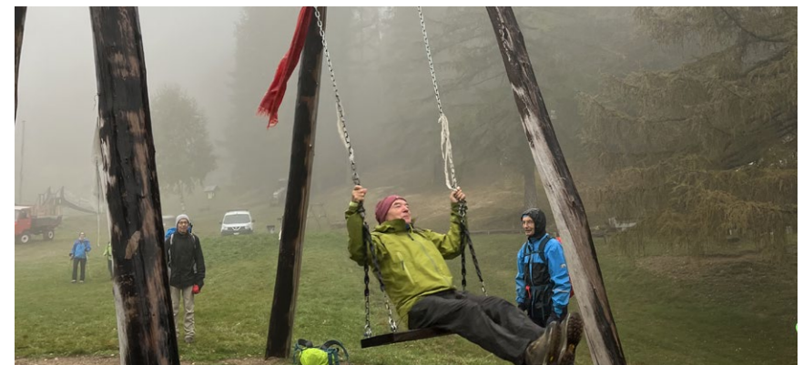
Sektionstour Denti della Vecchia vom 18. Oktober 2023