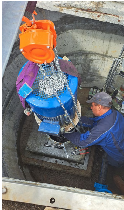
Kontrolle der Turbine

Als wir vom Vorstand angefragt wurden, etwas über die Wasser- und Stromversorgung auf der Hütte zu schreiben, machten wir uns einige Gedanken, was man zu diesem Thema schreiben könnte. Das Thema wäre dann auch in einem Satz mit folgender Aussage erledigt: «Wir haben bei entsprechender Wartung der Anlagen genug Wasser und Strom zur Verfügung». Wie bei einem Auto, wo es ohne Zweifel eine Antriebsquelle braucht, ist das Drumherum wie Getriebe, Bereifung, Fahrkompetenzen des Fahrers etc. ebenso wichtig, um ohne Probleme mit der nötigen Sicherheit von A nach B reisen zu können. Gleich verhält es sich auf der Hütte. Es braucht einiges mehr, damit die vorhandenen Ressourcen optimal genutzt werden können und möglichst wenig Energie auf die Hütte geflogen werden muss.